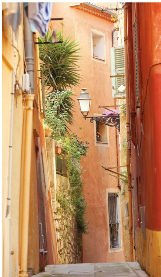
Le vieux Nice, ruelle du Malonat