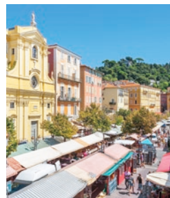
Principale voie piétonne du Vieux-Nice, le Cours Saleya et son marché

Creusé au 18 e siècle, le port Lympia est avec celui de Cannes l'un des plus vieux ports de la côte. Situé au pied de l'ancienne citadelle, ce chantier d'envergure aura demandé plus d'un siècle de travaux et le talent de nombreux ingénieurs tels que Caravadossi ou Antoine Verani .