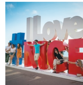
« # I Love Nice », la structure emblématique, quai Rauba Capeu