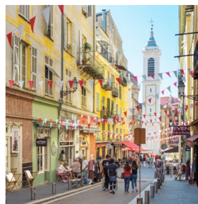
La rue Rosetti et la Cathédrale Sainte-Réparate

2 E AÉROPORT INTERNATIONAL APRÈS PARIS AVEC 114 DESTINATIONS DANS 40 PAYS